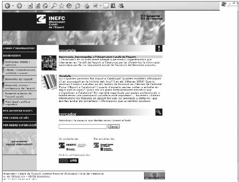
Figura 1. Página principal del Observatorio Catalán del Deporte.

A continuación se explica con concreción a qué deporte hace referencia toda la información recogida. Ésta se basa en la definición de deporte que se encuentra en la Carta Europea del Deporte de mayo de 1992, adoptada por la conferencia de ministros de deporte del Consejo de Europa. En el artículo 2 dice: